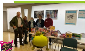
Vide ta chambre

Cette année encore le vide ta chambre organisé par le Conseil Municipal d'Enfants et de Jeunes a rencontré un franc succès. Les visiteurs étaient au rendez-vous pour acheter des bonbons, ce qui a permis d'offrir une vingtaine de jouets neufs au profit des Restos du Coeur.